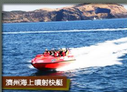
濟州海上噴射快艇