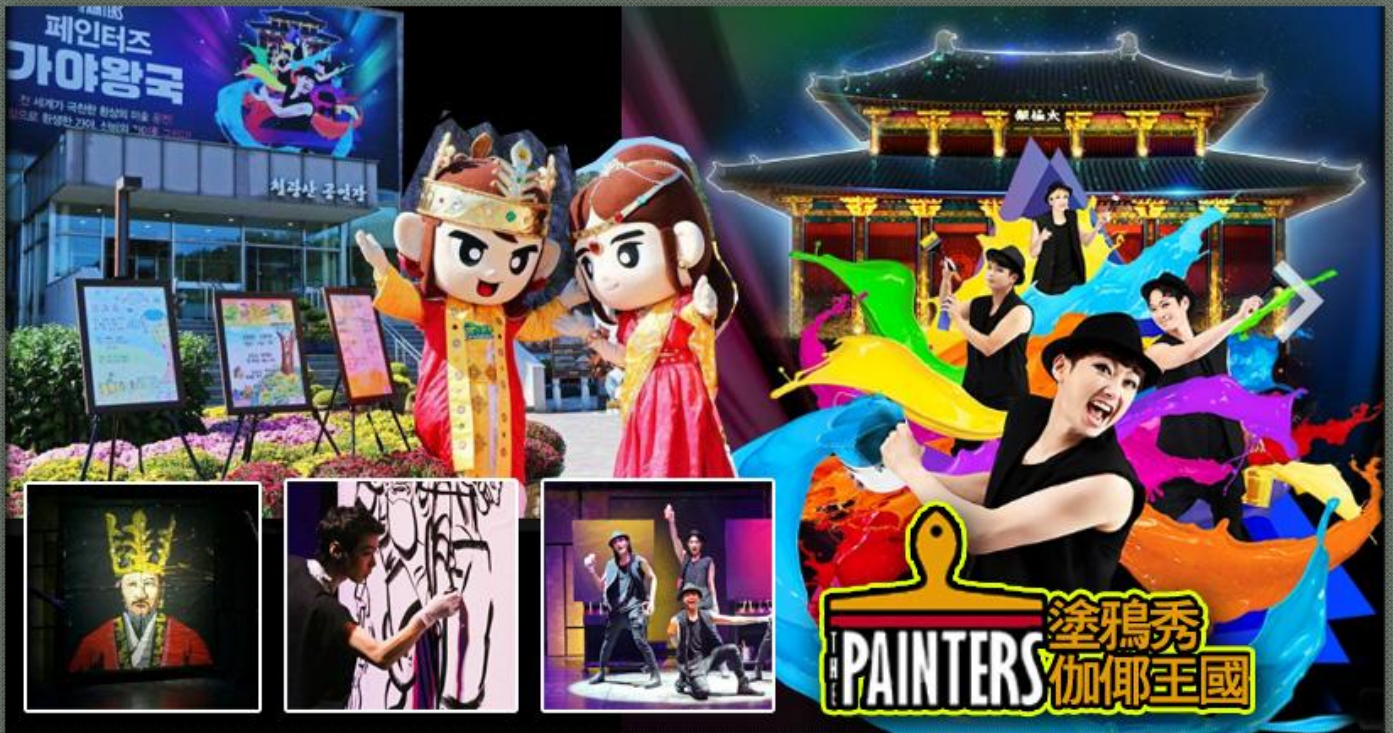
PAINTERS 塗鴉秀 伽倻王國