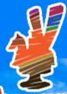
가야테마파크 金海伽倻主題公園