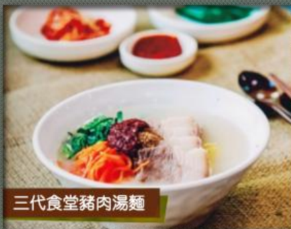
三代食堂豬肉湯麵